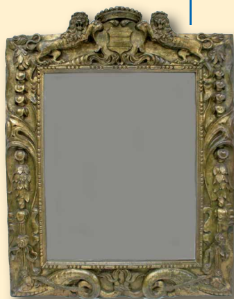
De spiegel in de vestiaire met het wapen van Van Wittenhorst.