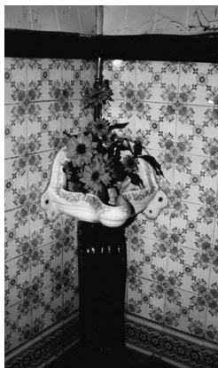
Het versierde urinoir