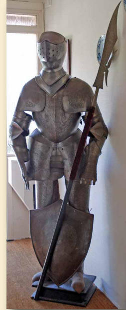
De ijzeren man

Voor het huis zelf was er binnen de familie Haffmans geen belangstelling. Hoe imposant ook, het was er niet altijd even geriefelijk en het onderhoud had een grote achterstand opgelopen. Het karakteristieke torentje boven op de Villa was al enige jaren daarvoor verwijderd omdat het in de deplorabele toestand verkeerde en dreigde in te storten. Het pand ging in 1983 in de verkoop. Evenals in de huidige tijd zat de markt voor onroerend goed toen behoorlijk op slot. Het was een opluchting voor de familie toen de jonge Beringse ondernemer Piet Wijnen voor 450.000 gulden de hoofd- en bijgebouwen en de ongeveer 35 hectaren bijbehorende bosgrond kocht. Wijnen ging al kort na de aankoop op een eigenzinnige wijze over tot sloop, grootschalige verbouwing en gedeeltelijke restauratie van het pand. Het omliggende park vond al snel een bestemming als golfbaan, hetgeen Wijnen nog een fikse boete voor illegaal kappen opleverde. Het was allemaal in de ogen van veel Heldenaren wel erg vlug en rigoureuus gegaan. Het aanhouden van de Villa in de oorspronkelijke staat zou echter ook geen reële optie zijn geweest.