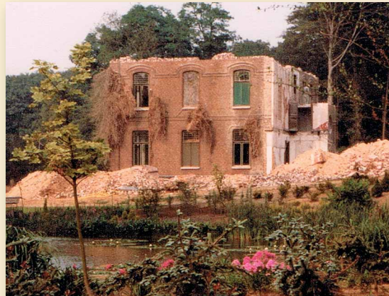
Het einde van de Villa.