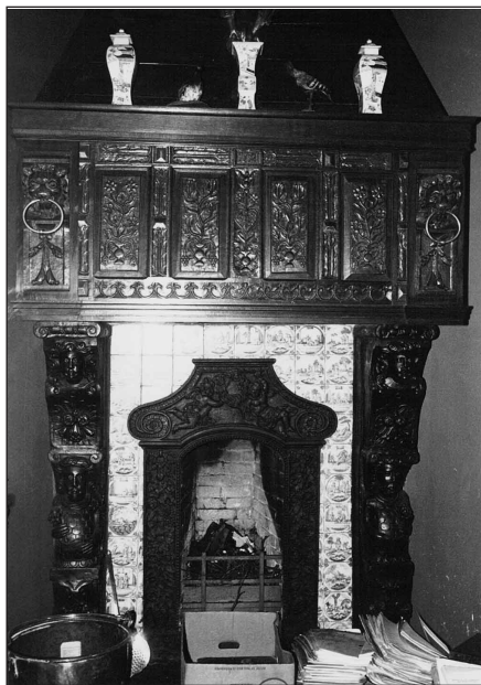
De fraaie schouw van de open haard in de jachtkamer.