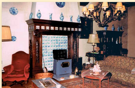
De grote kamer