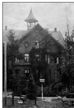
De grote kamer

Alle tien kinderen groeiden in dit grote huis op. Als oudste kleinkind heb ik in mijn jeugdjaren veel tijd in de Villa doorgebracht. Ik was toen al zeer geboeid door de grote hoeveelheid kunst en antiek die in het grootouderlijk huis te vinden was. Deze fascinatie heeft zeker invloed gehad op mijn latere beroepskeuze: sinds 1975 ben ik antiquair en taxateur in