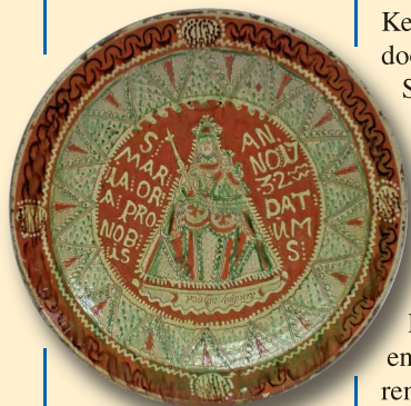
De aardewerken schotel

De blik van de bezoeker van de grote kamer kon niet ontkomen aan een grote hoeveelheid blauwe borden aan de muren en dito vazen op kasten en piano. Er zat niet veel lijn in. Delfts aardewerk stond naast Chinees porselein, en Japanse stukken waren broederlijk verenigd met Engels Wedgwood. Een beslist erg fraai en interessant object bevond zich in een hoek, boven de piano. Het was een grote Nederrijns aardewerken schotel met de afbeelding van de Lieve Vrouwe van Kevelaer, die blijkens het opschrift in 1732 vervaardigd was door Paulus Kuijpers, een pottenbakker die werkzaam was in Sevelen, nu gelegen vlak over de Duitse grens, toen evenals Helden deel uitmakend van Pruisisch Opper-Gelder. Van deze schotel wordt gezegd dat ze een huwelijksgeschenk aan een der voorvaders was. De plaats Sevelen ligt op enkele kilometers afstand van het dorp Aldekerk, waar de voorouders van de familie Haffmans woonden voordat ze rond 1800 in westelijke richting de Maas overtrokken. Het aanzien van de grote kamer werd gecompleteerd door enkele grote meubels zoals een fraaie beeldenkast uit de renaissance, een barokke kussenkast, een fijnhouten cilinderbureau met fraai inlegwerk, en een grote eettafel waarvan de poot versierd was met rijk beeldhouwwerk.