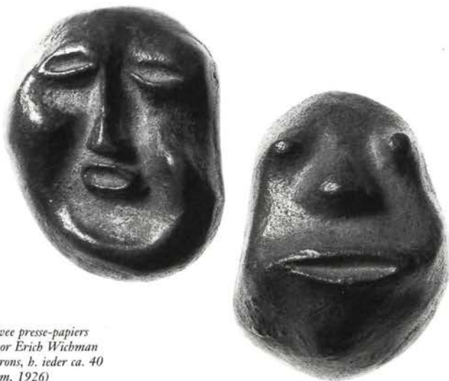
Twee presse-papiers door Erich Wichman (brons, b. ieder ca. 40 mm, 1926)

Begin 1925 vertrok Wichman naar Parijs, waar hij meewerkte aan de totstandkoming van het Nederlands Paviljoen op de Exposition des Arts Décoratifs et Industriels Modernes , de overzichtstentoonstelling van toegepaste kunsten waaraan de term 'Art Deco' rechtstreeks is ontleend. Na afloop van deze tentoonstelling bleef hij in Parijs hangen, waar hij bij gebrek aan inkomsten snel in diepe armoede verviel. Na enige tijd dakloos te zijn geweest, nam hij in juni zijn intrek in de goedkoopst denkbare vorm van behuizing die hij kon vinden: een omgebouwde buitenplee op de binnenplaats van een hotel achter het Gare de Montparnasse. Gelukkig slaagde Wichman erin met hulp van enkele mecenasen een kleine artistieke productie op gang te brengen. Het kan dan ook geen toeval zijn dat hij juist in de dagen van zijn diepste ellende het insigne voor de VPK ontwierp. Begeer en Brinkgreve hebben ongetwijfeld met het verlenen van de opdracht een mogelijkheid gezien hun oude vriend even vooruit te helpen. De