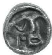
Het insigne voor de Vereeniging voor Penningkunst door Erich Wichman (zilver, 22 mm)